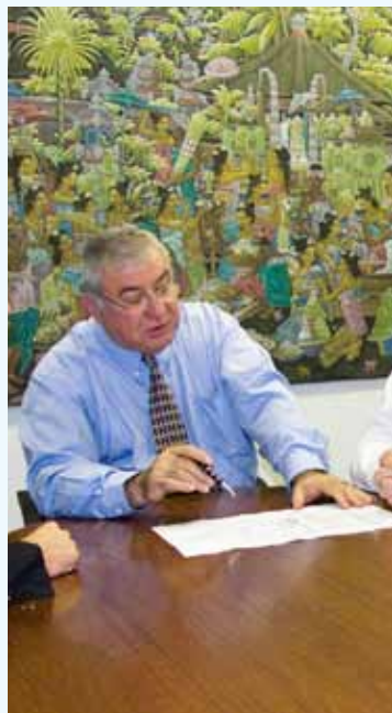
Krajobrazni arhitekt i arhitekt za sportske terene