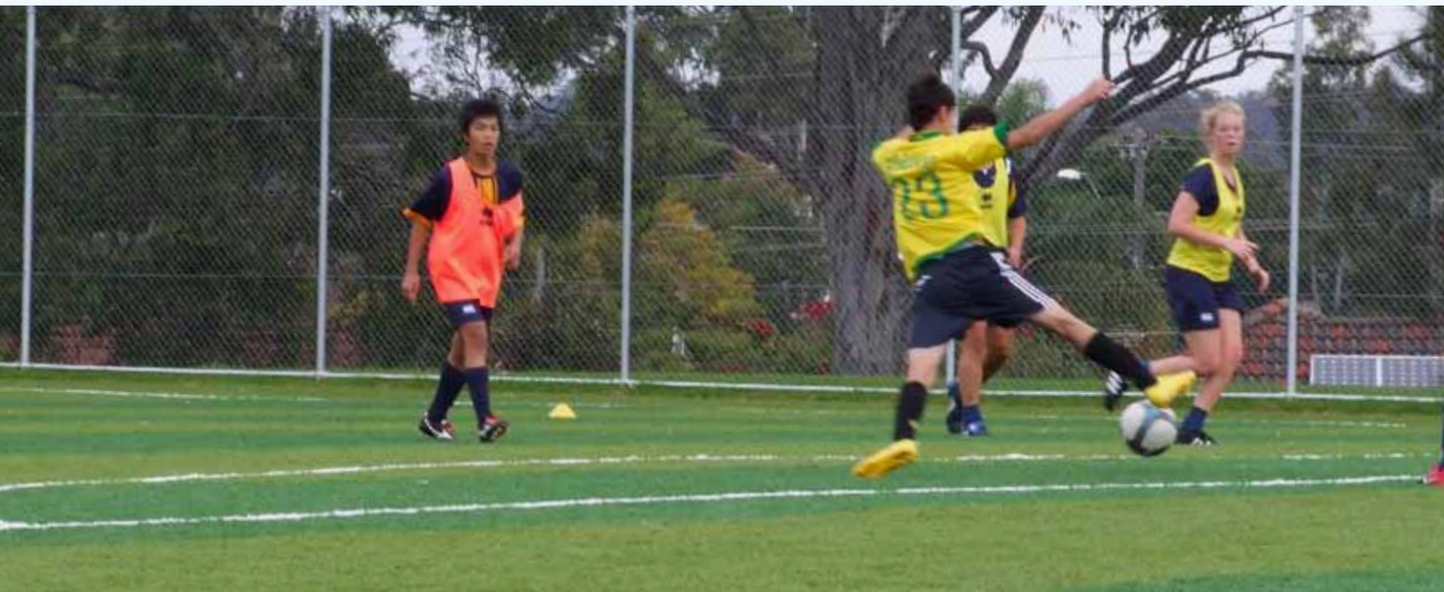
Westfields Sportska Škola, Australia '2010