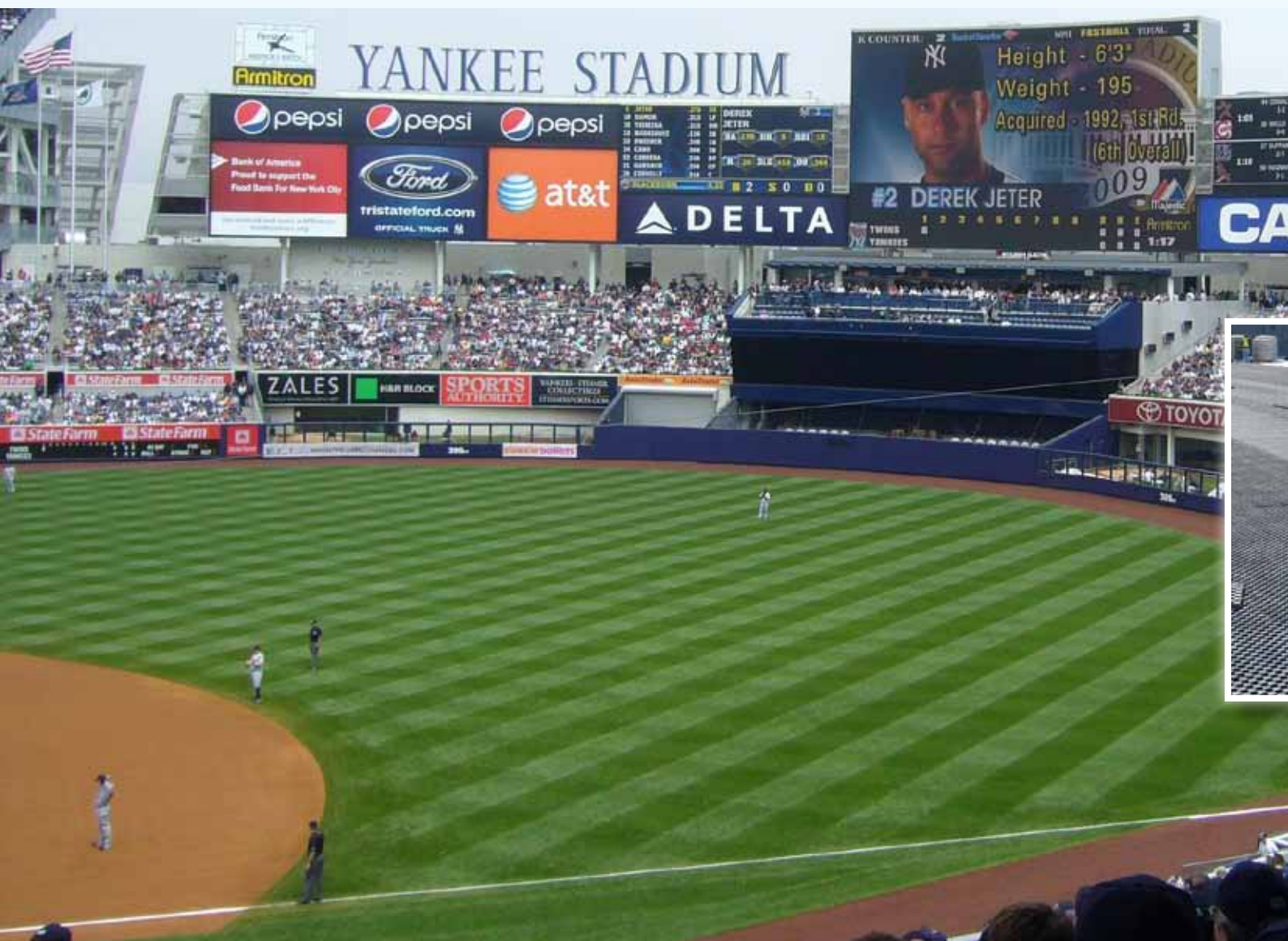
Yankee Stadium, USA '2009

Bejzbolski teren iz snova sa sustavom drenaža od Atlantisa.