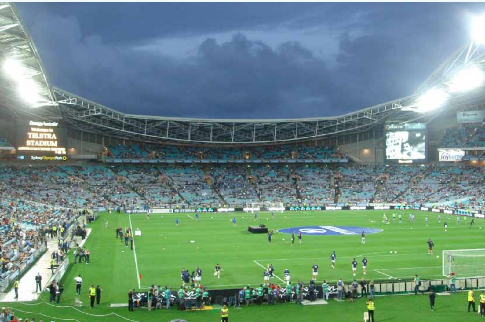
Sydney Olympic Park, Australia '2000

Atlantis® Flo-Cell® je upotrijebljena ispod travnjaka, iznad cijele trkačke staze kako bi se omogućio prijelaz podloga sa travnjaka nogometnog igrališta na gabarite travnjaka olimpijskog stadiona. Atlantis® Flo-Cell® je štitila trkačku stazu i pri tome dozvoljavala otjecanje vode kroz profil igrališta.